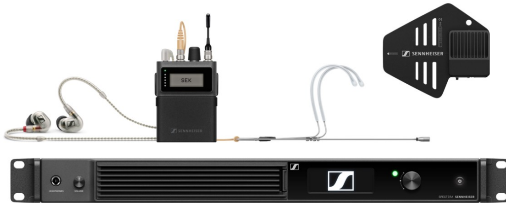
森海塞尔 Spectera 宽带双向数字无线解决方案（图为 1.4GHz 频段版本的腰包及天线）

将多通道系统集至单个 1U 机架系统，在同一射频通道和单一腰包发射其中实现无线麦克风、监听系统和控制数据的同步传输，为现场演出、影视制作等专业场景提供前所未有的灵活性和效率。