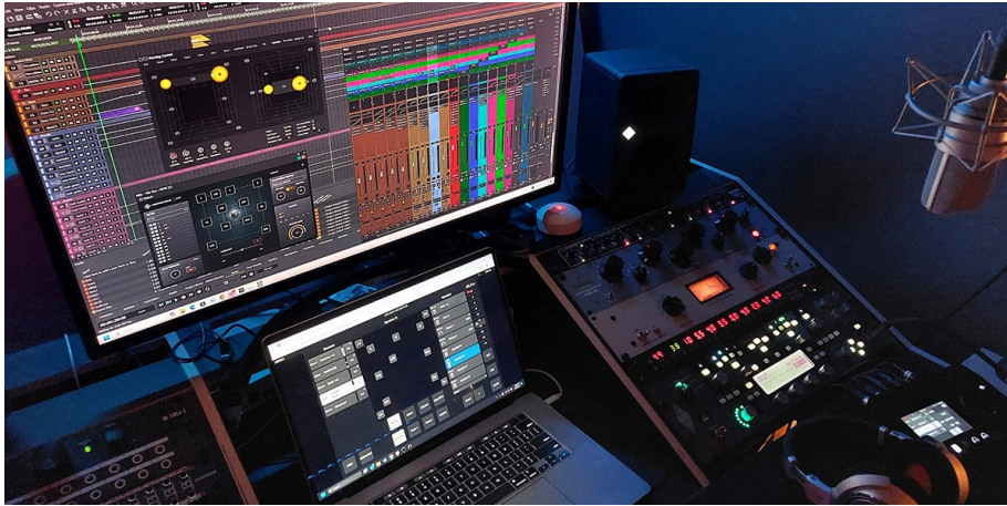
Merging Technologies 将展示 Pyramix 数字音频工作站

诚邀您莅临 A 区 2.2 馆 B16 森海塞尔集团展台 ，与我们共绘专业音频行业新篇章。