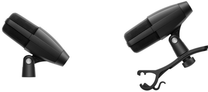
MD 421 Kompakt (左) 和 MD 421 Kompakt (鼓套装)，后者额外配有 MZH 鼓夹