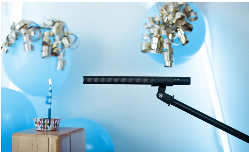
50 载传奇经典 MKH 416，依旧屹立行业前沿